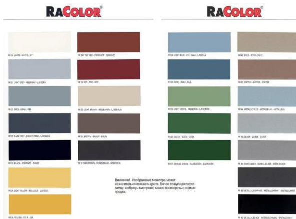
Карта цветов и покрытий