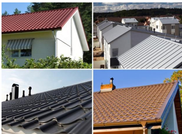
Металлочерепица и фальцевая кровля