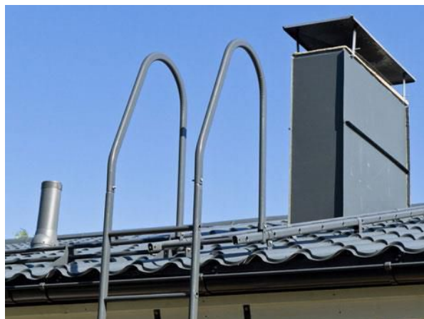
Элементы безопасности и вентиляция